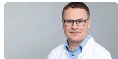
Professur für KI in der Augenheilkunde