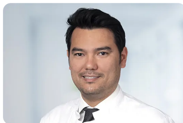
Port Delivery System (PDS)

Der Podcast richtet sich an Menschen mit Netzhauterkrankungen, ihre Angehörigen sowie Fachleute im Gesundheitswesen. Komplexe wissenschaftliche Themen werden für die Zielgruppe verständlich aufbereitet.